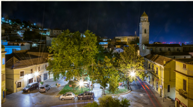
Piazza Zampillo e adiacente Chiesa di Santa Barbara

Come raggiungere la Chiesa di San Sisinnio dalla Via Nazionale (Villacidro)